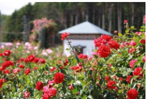
⑥岩見沢公園・バラ園