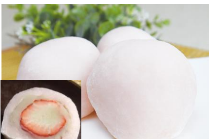
④カワダ菓子舗いちご大福