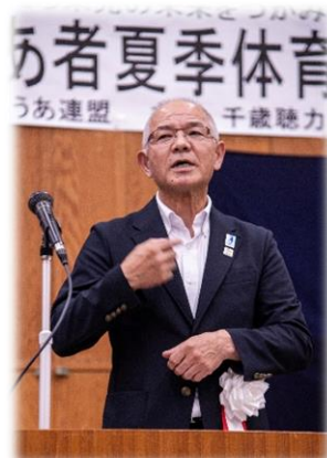
大内理事長のご挨拶