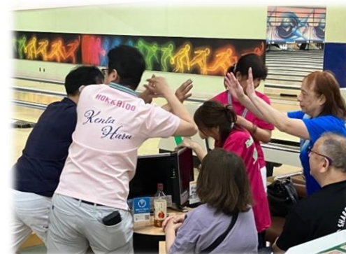
大内理事長の始球式でスタート！