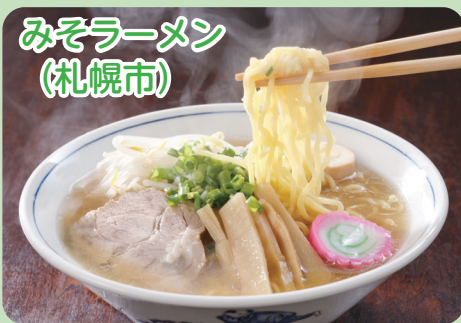
みそラーメン (札幌市)